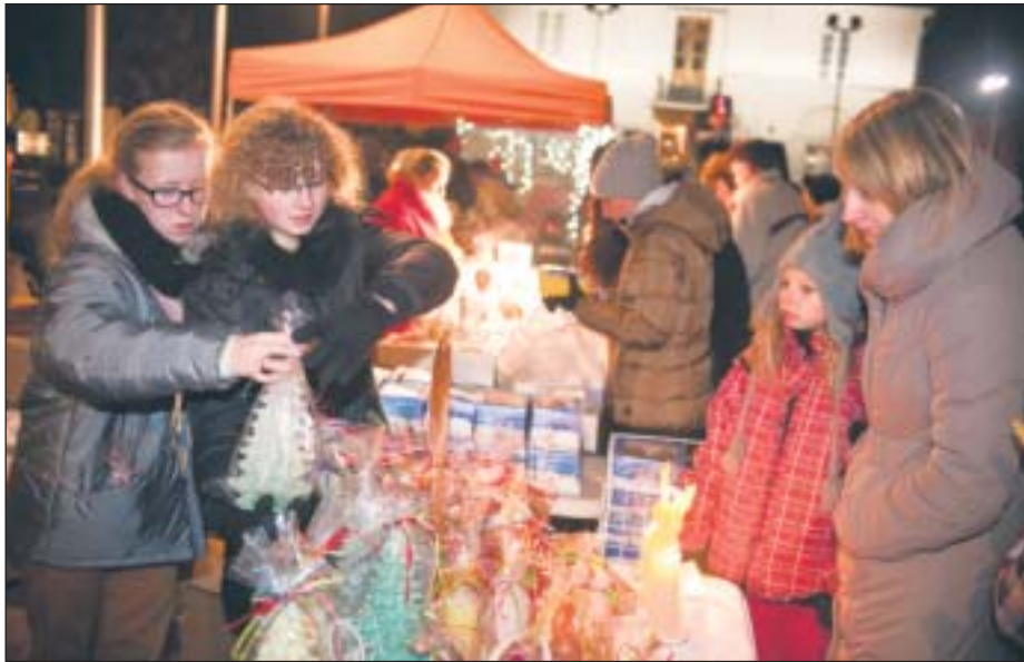
W tym roku choinka rozbliśnie podczas świątecznego kiermaszu

Ze sceny rozbrzmiewać będą zimowe piosenki, a animatorzy poprowadzą zabawy i konkursy z nagrodami. O 12.30 wszyscy poddamy się świątecznej atmosferze, oglądając spektakl pt. „Magia Świąt”. Spóźnialscy mogą liczyć na powtórkę o 15.20.