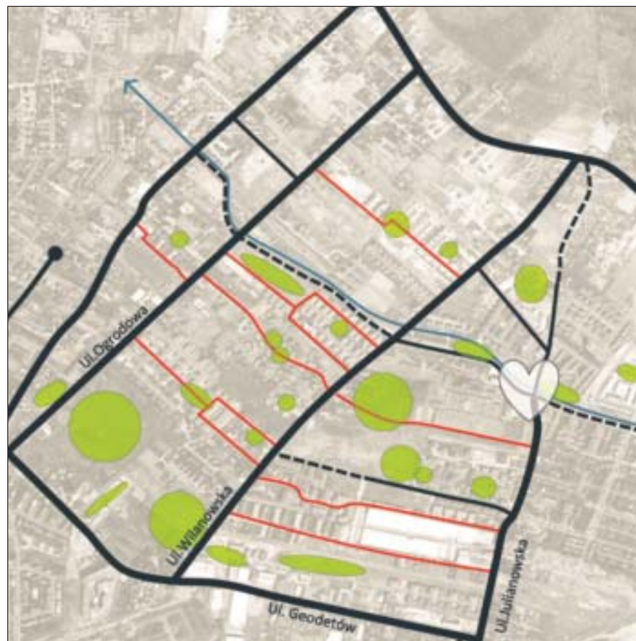
Zielone tereny na obszarze Józefosławia