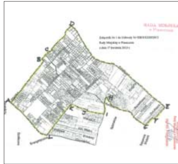
Granice obszaru, na którym gmina przystąpiła do zmiany planu zagospodarowania przestrzennego

Wnioski należy składać do Burmistrza Miasta i Gminy Piaseczno, który jest organem właściwym do ich rozpatrzenia, z podaniem imienia, nazwiska lub nazwy jednostki organizacyjnej, adresu wnioskodawcy, przedmiotu wniosku oraz oznaczenia nieruchomości, której dotyczy.