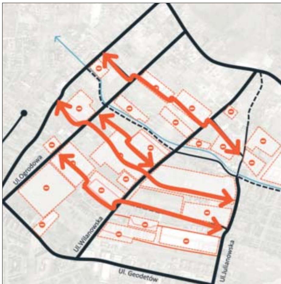
Holendrzy zobrazowali problemy związane z komunikacją na osi wschód – zachód na terenie Józefosławia