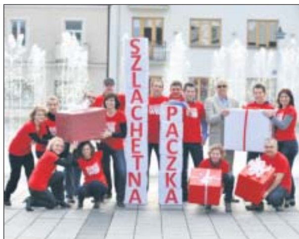
Do akcji przyłączył się także burmistrz oraz pracownicy urzędu

W skali całego kraju tylko w 2012 roku Szlachetna Paczka dotarła do ponad 13 tys. rodzin w potrzebie, czyli do ponad 55 tys. osób żyjących w niezawinionej biedzie – osób starszych, samotnych, rodzin dotkniętych chorobą lub niepełnosprawnością, samotnych rodziców i rodzin wielodzietnych w trudnej sytuacji materialnej. Łączna liczba zaangażowanych w projekt wolontariuszy, darczyńców i rodzin w potrzebie sięgnęła 300 tys. osób. Średnia wartość paczki dla jednej rodziny zade-